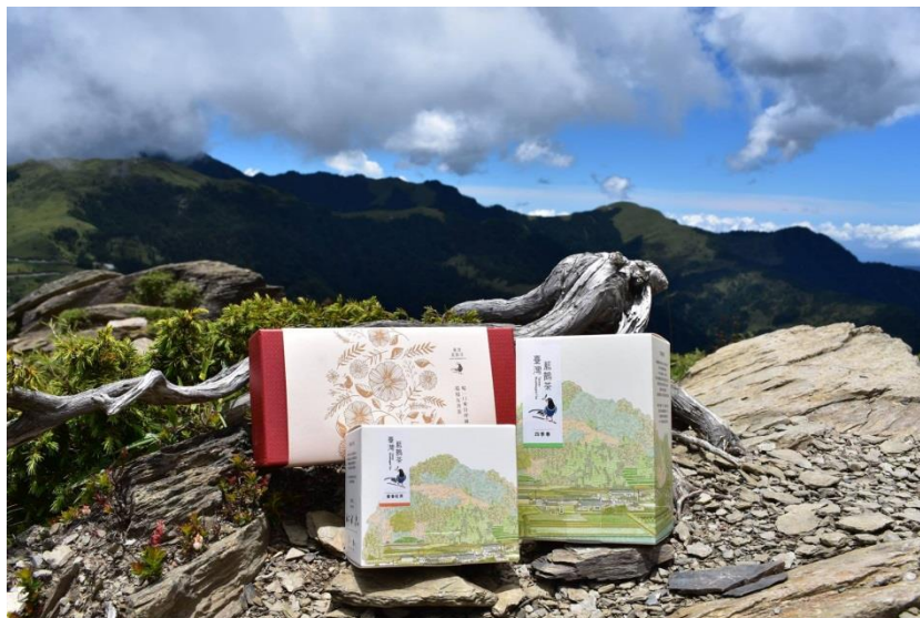
圖 2-4 台灣藍鵲茶

台灣藍鵲茶為台灣第一個以保育生態環境為訴求的茶葉品牌，其以「流域收復」為策略，透過公眾參與地理資訊系統 (Public Participation GIS, PPGIS)，與茶農一同推動坪林為重視棲地保存的生態村，並致力於無農藥生態村友善環境的茶品，用三倍的價格收購茶，確保茶農的價值，期建構翡翠水庫上游集水區為無農藥的流域，讓居民、產業和生態環境共存共榮。藉由品牌來守護茶園與生態，透過認同消費讓更多茶農、青年參與友善環境耕作，近年更嘗試與企業推動茶葉農園認養契作，展開局部圈養，得到多家知名企業支持，並獲得各家媒體爭相報導，更曾榮獲兩岸烏龍茶比賽金牌獎之肯定。