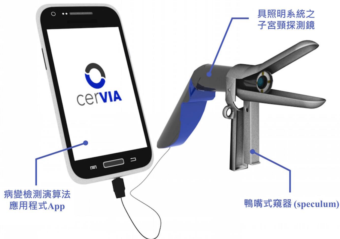
圖 2-1 子宮頸癌自我檢測裝置與系統—cerVIA