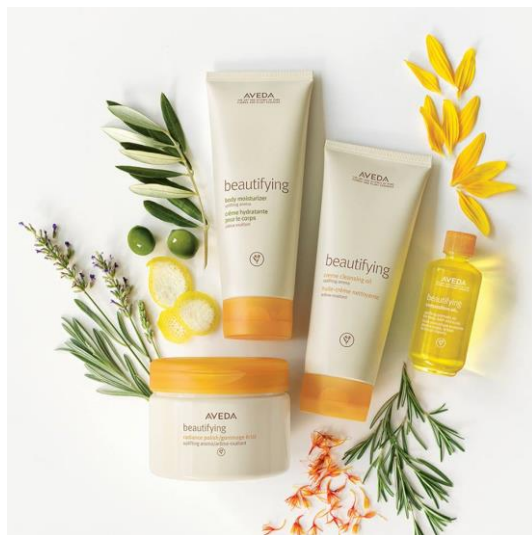
圖 2-3 肯夢 Aveda 及產品