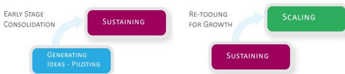
圖 1-2 麥康諾社會創新基金支援重點