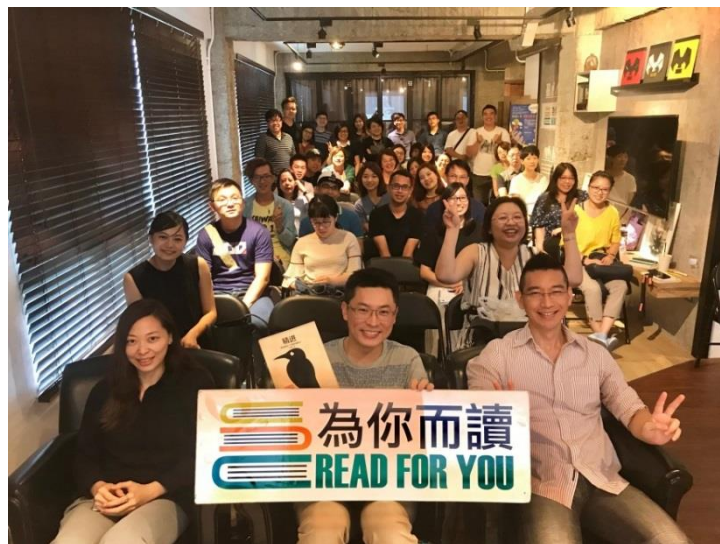
圖 2-2 為你而讀說書活動

以「為你而讀」的知識社群活動最負盛名，並與生態綠、慢飛兒、愛物資、友善大地、眾社企等多家知名社會企業，合作舉辦推廣活動及講座，曾榮獲非凡新聞、中天新聞及許多平面和網路媒體爭相報導，盼望每個人都能透過閱讀連結更浩瀚的世界。