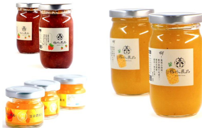
圖 2-2 格外農品產品（果茶醬）

格外農品以「惜物善用」為初衷，以提升農品有效利用率為目的，與友善耕作的農友們共同收購較難進入市場的「格外品」，「格外品」一詞源自日文，意指「規格以外的產品」，臺灣人稱為 NG 品或瑕疵品（賣相、規格不符或生產過剩但不影響品質的水果）。此外，與國際衛生標準食廠技術合作、結合公平貿易認證的砂糖，並符合國際的食品安全標準，選擇與通過認證的食品工廠合作，並於果醬完成後再送農藥殘留檢驗，達到食品安全、衛生條件、製程可追溯、品質穩定等四大要件。