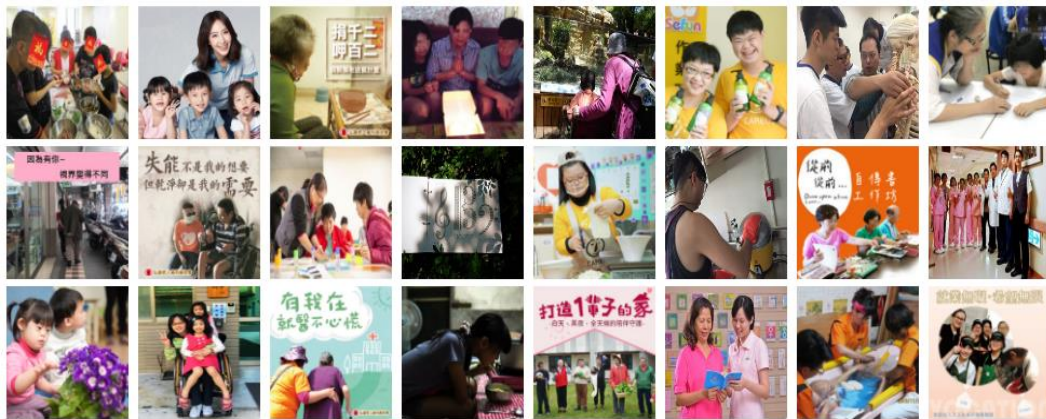
圖 2-3 社會網絡股份有限公司募款計畫