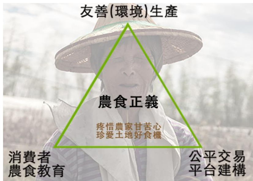
圖 2-4 好食機運作模式

好食機以「友善環境生產」、「消費者農食教育」、「公平交易平台建構」三項使命為初衷，致力於推動農食整合，透過資訊透明、審議機制和舉辦社區農食講堂等，推廣農食教育，透過參與式驗證鼓勵農民和消費者直接參與，建立雙向溝通管道，消除資訊不對等之問題。生產過程透明化，以當季盛產農作物為主要原料，不添加任何化學添加物，希冀建構一個農食互惠的網絡，使消費者和生產者成為互助、互惠的共同體，開創友善、公平、安心的新農食模式。