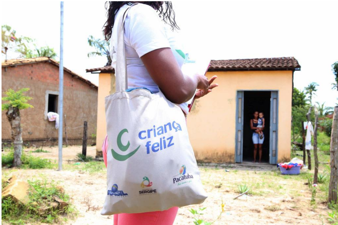
圖 2-1 快樂兒童方案社工師已觸及巴西 25 個州

標為服務四百萬人；而在預算方面，2017 年的預算為 1 億美元，每名兒童每月之花費約為 20 美元。