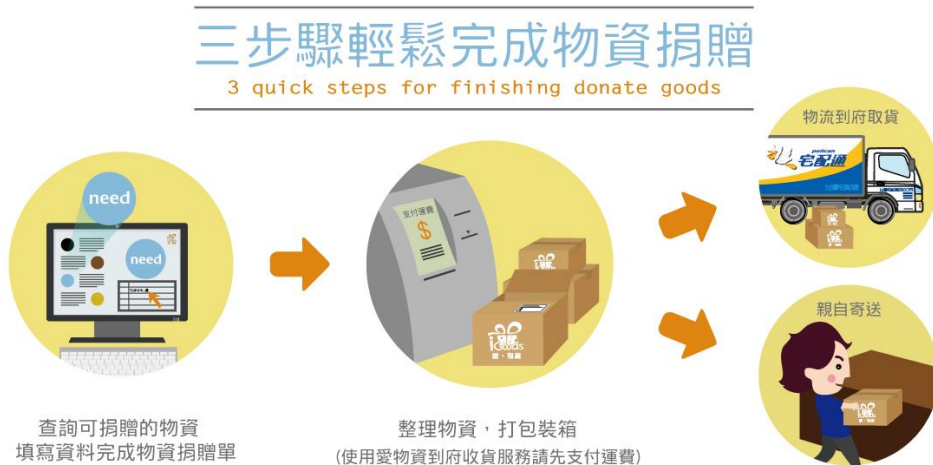
圖 2-5 愛物資媒合平台捐贈流程

系統化管理以及數據分析和應用，透過循環經濟和共享經濟，打造出物品循環生態圈。全臺已有 100 多家社福單位配合使用，逐步實踐物盡其用、友善環境之願景。