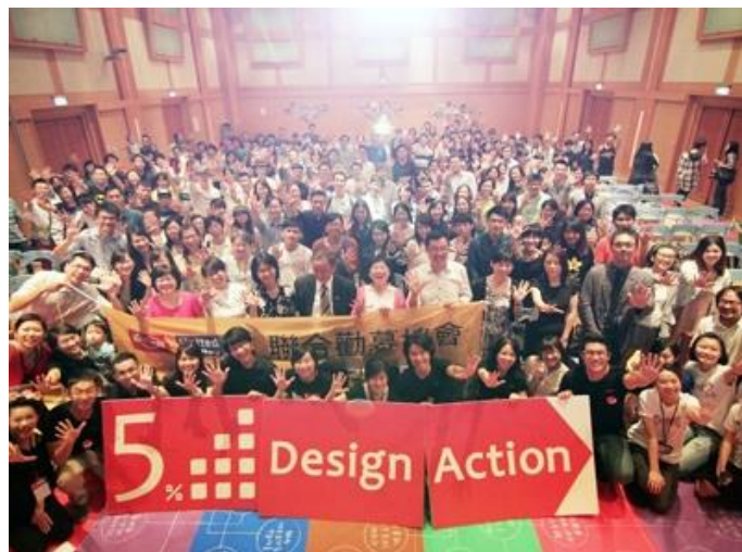
圖 2-4 聯合勸募與 5% Design Action 跨界合作提出四大兒少教育設計模組

5% Design Action 社會設計平台不同於公益捐款方式，乃透過實際的設計行動，鼓勵業界設計師及相關專業人士共同投入 5% 的業餘「時間」與「專業」，針對社會課題與挑戰與第一線的組織人員一同進行社會創新工作提出一套新解方。其目的不在於取代現存社會中的各類組織，希冀透過實際的設計行動，驅動各個組織合作與創新，共創更美好的社會環境。