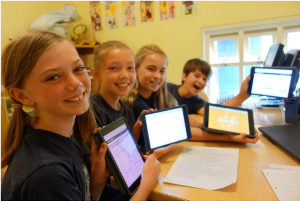
圖 2-1 巴斯市學校使用開放能源數據教育學生永續發展的價值