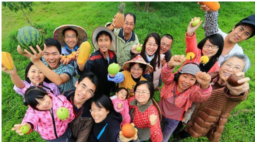
圖 2-3 直接跟農夫買社會企業

直接跟農夫買原為社群組織，並於 2014 年成為社會企業。建立農夫跟消費者之間公平交易平台，以產地直銷的概念連結偏鄉小農，重組關係疏離的都市與鄉村。並透過實地訪查進行故事行銷提升農業質感，改善社會大眾對農人的刻板印象。此外，更吸引年輕創意人才投入，為農產業找適合新世代的位子努力，讓老化萎縮的農產業永續發展。