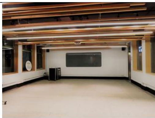
107 大型會議室 A 21坪