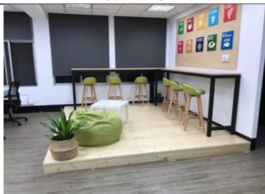
201 共同工作空間 A