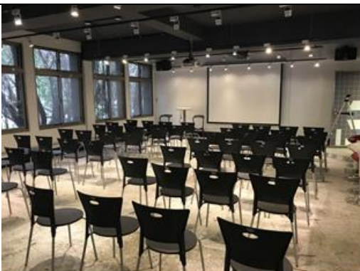
208 大型會議室 B