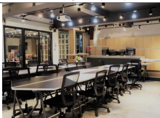
108 創藝廚房 21坪