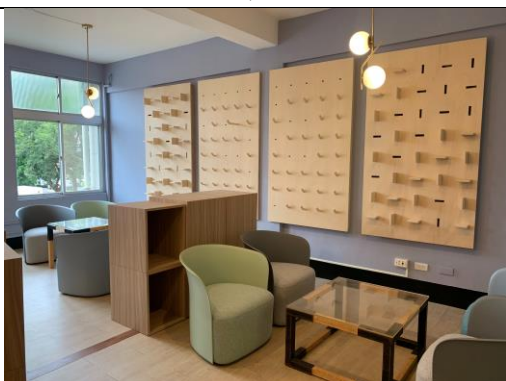
203 共同工作空間 B